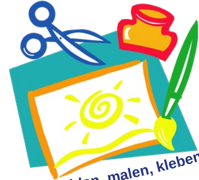
Basteln, schneiden, malen, kleben, falten, ...