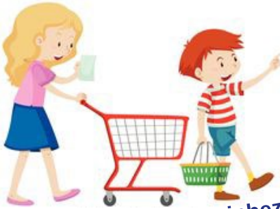
Beim Einkaufen / Wägen einbeziehen