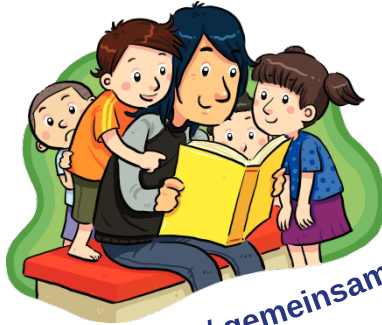
Vorlesen / gemeinsam lesen